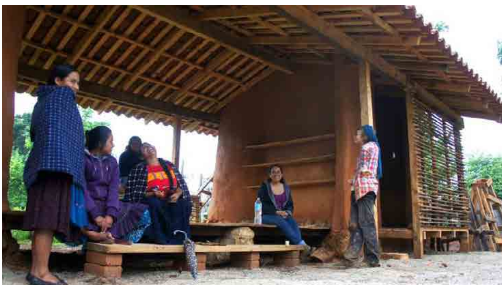
Figura 17. Programa VACA, compromiso y disfrute, 2013-16.

El estado mental de consciencia social y personal mantenido en los casos analizados condujo al desarrollo de una actitud que benefició a las personas y a sus ecosistemas (fig. 17). Todo lo anterior nos lleva a la propuesta de observar la actitud como vector transversal en futuros proyectos para hacer los asentamientos humanos más humanos.