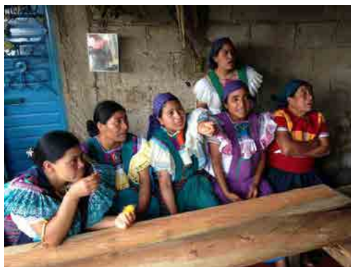
Figura 9. Programa VACA, diferentes actitudes durante los procesos de diseño participativo en Amatenango del Valle, 2016.

Cada uno de los actores tenemos sueños, deseos, necesidades, valores, intenciones, motivación, compromisos, etc.; cada uno de los actores tenemos una actitud (fig. 9). Cuando los procesos son participativos se incluyen más actores en la toma de decisiones. Los procesos pasan a ser más lentos y complejos si se comparan con los procesos autoritarios o los que ignoran a los actores que no ostentan el poder.