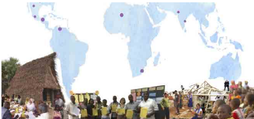
Figura 2. Mapa de los proyectos.

Algunos casos han sido live projects 3 como el programa VACA, otros casos son proyectos de cooperación al desarrollo formulados y ejecutados siguiendo diferentes métodos de gestión. 4