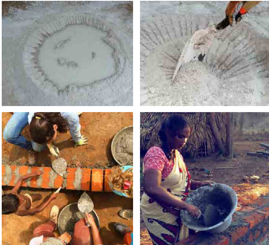
Figuras 12, 13, 14, 15 y 16. Programa VACA, técnicas adecuadas a cada participante de las obras, 2013-16.

En un principio el uso de técnicas vernáculas y materiales naturales era complejo porque los técnicos y las comunidades tenían visiones diferentes y actitudes enfrentadas. Los técnicos, los defendían desde el conocimiento, las comunidades los rechazaban, emocionalmente, por percibirlos ligados a la pobreza que querían dejar atrás. Luchar contra el rechazo de dichas técnicas parecía no respetar la decisión de la comunidad. Sin embargo, cuando los técnicos consiguieron entender y empatizar con este rechazo pudieron comprender que la decisión se quedaba en el componente emocional, con independencia de los argumentos cognitivos. Así, pudieron aportar un argumento emocional a su vez —la arquitectura con materiales naturales y técnicas vernáculas es de la máxima calidad y belleza— y ello permitió a las comunidades decidir nuevas opciones. Trabajar desde la empatía ayuda a superar obstáculos.