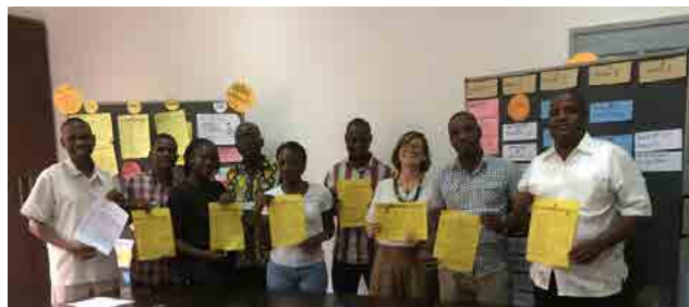
Figura 5. Equipo de operacionalización de la Política de Operación y Mantenimiento de los Edificios Públicos de Mozambique.

Al analizar el proyecto destinado a operacionalizar la política pública de mantenimiento de edificios en Mozambique (fig. 5), se aclara el papel de la actitud y sus tres componentes. En este enfoque transformador, la relación de asesoría establecida con los funcionarios implicaba que, a diferencia de una asistencia técnica, en lugar de realizar, se acompañaba a quienes realizaban, fortaleciendo sus capacidades. Teóricamente esto garantiza la apropiación del proceso por parte de una institución y refuerza las habilidades de quienes trabajan ahí. En la práctica supone un equilibrio, entre acompañar, hacer, esperar, percibir resultados, esperar, cambiar, aceptar, hacer, facilitar, motivar, etc. Si se añade el factor de diferencias culturales, la ecuación se hace más compleja. Una posible solución para facilitar su comprensión es observarlo desde la actitud.