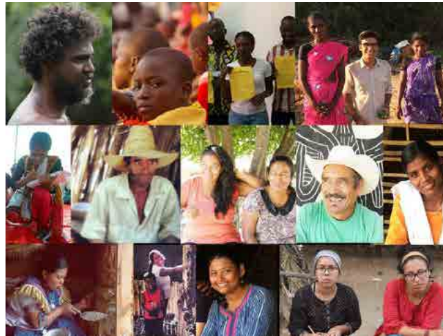
Figura 3. Vivir y trabajar para y con las personas.

los funcionarios públicos. En La Guaira se restauraron edificios patrimoniales para y con los estudiantes mientras aprendían oficios —carpintería, forja, albañilería, hostería y electricidad—. En Ciudad de Guatemala se rehabilitó un antiguo cine en centro cultural con y para los artistas. En Maputo se está definiendo el plan parcial del barrio de Chamanculo con y para sus habitantes.