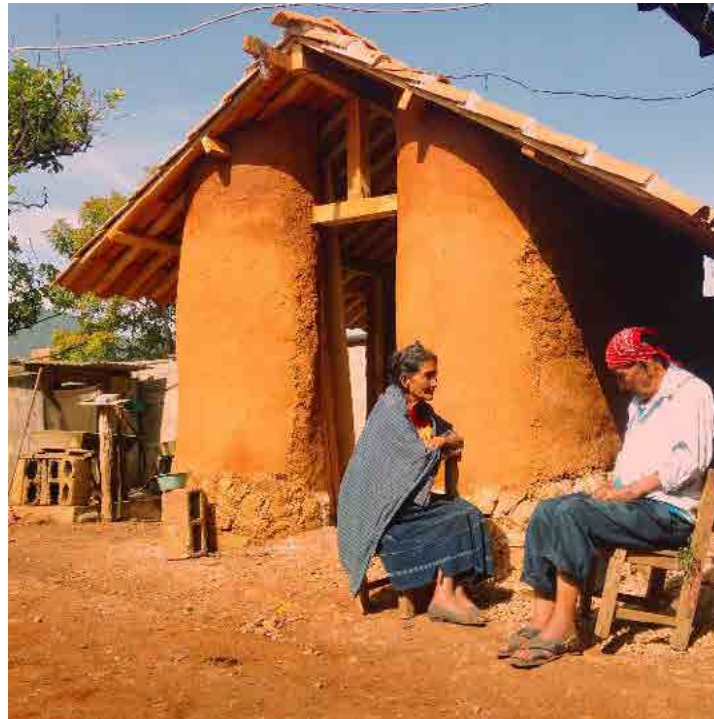
Figura 11. Programa VACA, teoría del bien común promovida por diferentes grupos indígenas de Latinoamérica, México, 2016.

Harvey (2003) mantiene que el derecho a la ciudad va más allá del acceso a la vivienda, las infraestructuras y servicios públicos; debe implicar el derecho a cambiar la ciudad. ¿Qué sucedería si este derecho fuera aún más inclusivo y considerara otros territorios habitables como las áreas rurales?, ¿qué sucedería si el derecho a cambiar la ciudad y las áreas rurales resultara de la suma de vivencias de individuos conscientes que buscan el bien común sin ignorar el impacto en un ecosistema finito?