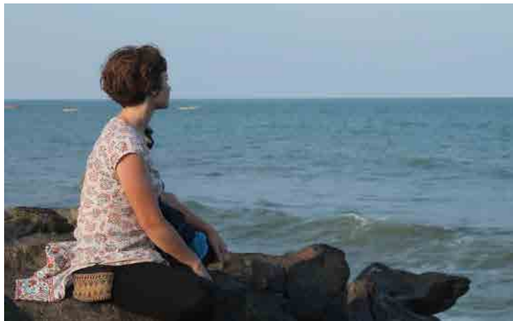
Figura 4. Entre las personas para y con quien trabajamos estamos nosotros mismos.

Aunque parezca obvio, entre las personas para y con quienes trabajamos están quienes facilitan los procesos. En los proyectos de cooperación se corre el riesgo de auto-esclavizarse para lograr los objetivos de cada proyecto, y ambas realidades no se deben perder de vista (fig. 4).