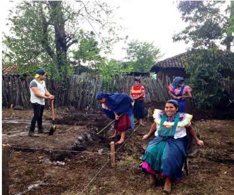
Figura 1. Programa VACA. Disfrutando del inicio de las obras de construcción del Centro Colectivo de Mujeres y Maíz en Amatenango del Valle, 2016.

Los casos no se analizarán con el mismo detalle, sino que de cada uno se destacarán exclusivamente los factores que ayuden a definir el objeto de estudio respondiendo a la siguiente pregunta: ¿cómo puede la actitud human building ante la profesión de la arquitectura y el urbanismo tener un impacto eco-social sobre la realidad que construimos?