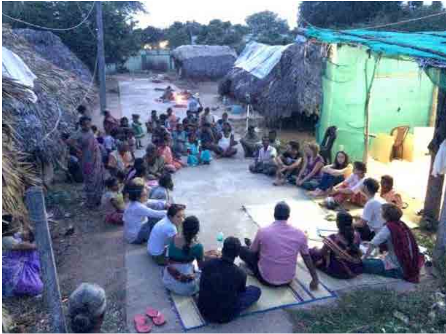
Figura 10. Programa VACA, diseño participativo en Kaliyanpondi, India, 2016.

Los actores de la cooperación al desarrollo están acostumbrados a trabajar estructurando desde «misión y valores». Human building no implica necesariamente trabajar en un marco de valores considerados positivos por quienes participan sino, primero, encontrar lugares comunes a través de una negociación en la que todas y todos ganamos ( win-win ) para después cumplir y ser coherentes con esos compromisos a través de la acción.